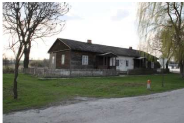
Obok kościoła znajduje się drewniana organistówka z 1908 roku , odnowiona stylowa plebania z 1913 roku ,