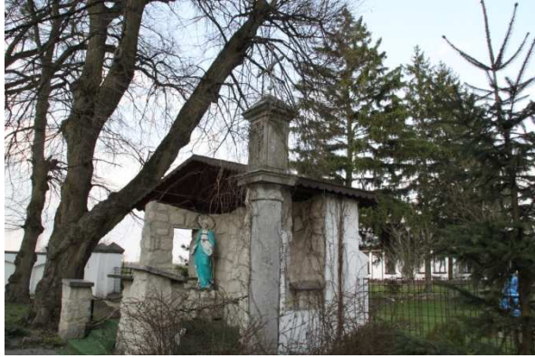
Przy świątyni stoi kapliczka słupowa z 1699 roku z figurką Matki Boskiej Niepokalanie Poczętej z 1873 roku , oraz kaplica pogrzebowa z początku XX wieku .