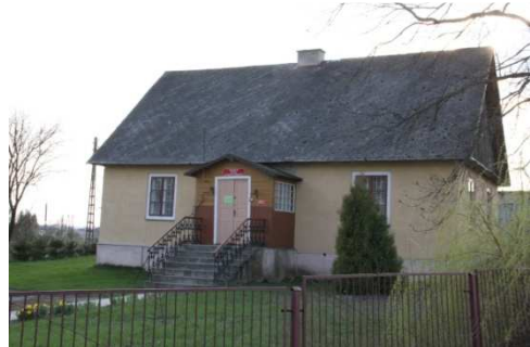
W budynku tym obecnie mieści się Muzeum Ziemi Starozamojskiej . W muzeum zgromadzono przedmioty i narzędzia dawniej używane w